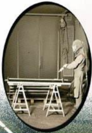
Sablage au corindon